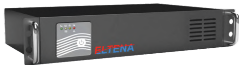
Intelligent II 600, 1000RM/RMLT

Линейно-интерактивные ИБП Строго синусоидальное выходное напряжение в батарейном режиме Компактный размер Широкий диапазон входного напряжения Модели для длительной автономной работы