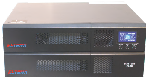
Monolith E 3000RTL с батарейным блоком BFR96-9E (приобретается отдельно)

On-line с двойным преобразованием Микропроцессорное управление «Холодный» старт ЖК-дисплей Зарядное устройство повышенной мощности Подключение батарейных блоков BFR96-9E