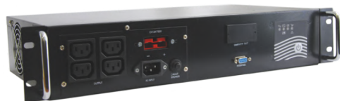
Intelligent II 600RMLT SE

Линейно-интерактивные ИБП Строго синусоидальное выходное напряжение в батарейном режиме Компактный размер Широкий диапазон входного напряжения Модели для длительной автономной работы